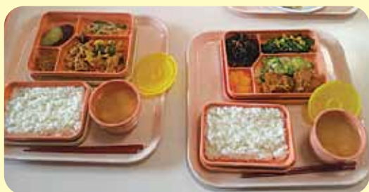
温もりのある昼食の一例