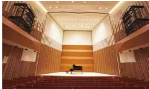
戸塚区民文化センター内ホール

平成31年4月開業予定である相鉄・東急直通線の新綱島駅(仮称)開業に合わせて進められる周辺のまちづくり。その中で、区民文化センターの整備が検討されます。