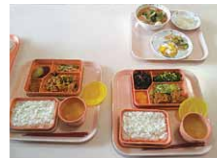
スクールランチの一例

平成19年の初当選以来、スクールランチの導入を提案し続けてきましたが、いよいよ実現の運びとなりました。更なる充実に向けて予算議会の中で取り組んでまいります。