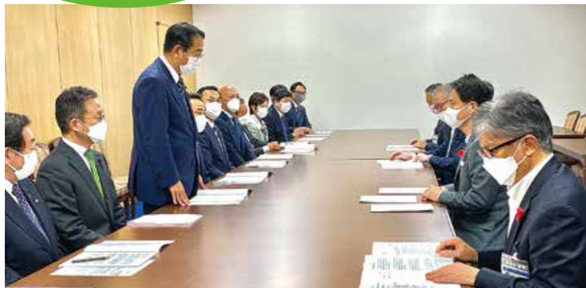
定期接種化について要望 (R4年10月14日)

高齢者の健康を脅かし、生活の質を低下させる带状疱疹の予防には、ワクチンが有効ですが、これまで全国の議会では、公明党が議論をリードし、各地で独自の一部助成が導入され負担軽減が図られています。公明党横浜市議員団もこうした動きと連携して「接種費用の助成」と「国への定期接種化の働きかけ」を横浜市に求めてきました(下記年表参照)。