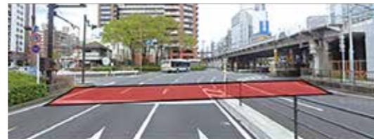
横断歩道の整備イメージ

地下鉄高島町駅2番出口付近の国道16号への横断歩道設置を令和3年より推進し、今年8月の県警協議にて横断歩道設置の了承が得られました。局長は、「今後は、横浜国道事務所にて設計を行い、県警との交通協議を実施し、交差点改良工事に着手予定であり、市として早期に工事着手ができるよう関係機関に働きかけを行う」と答弁しました。