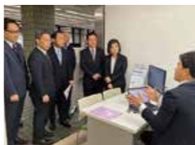
公明党の提案を受けて今年1月に設置

「お悔やみ窓口」の全区設置を 瀬谷区と鶴見区では、亡くなった方に関する煩雑な手続をサポートする「お悔やみ窓口」がモデル設置され、好評を集めています。そこで、早急に全区で展開すべきと訴えました。